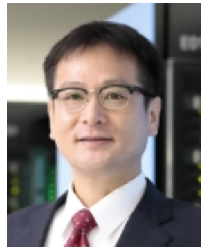
坪倉 誠教授 (神戸大学)