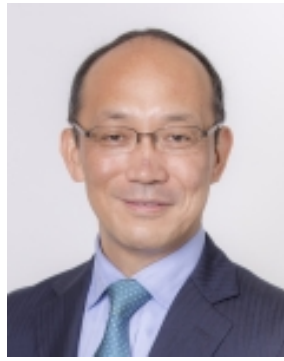
酒井 幹夫教授 (東京大学)