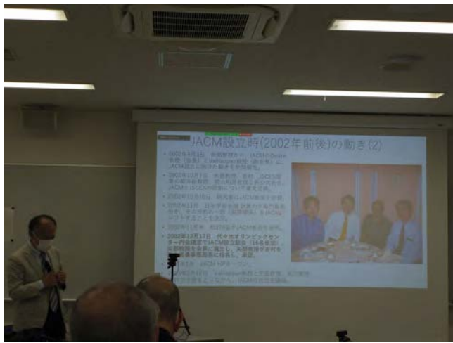
写真2 吉村忍教授による特別講演