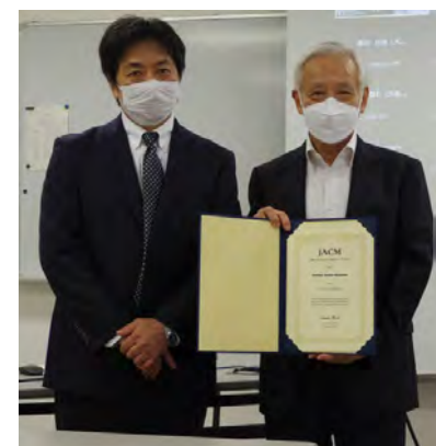
写真1 名誉員賞授与の様子