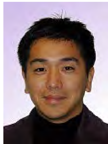
古川知成教授 (Univ. of Virginia)