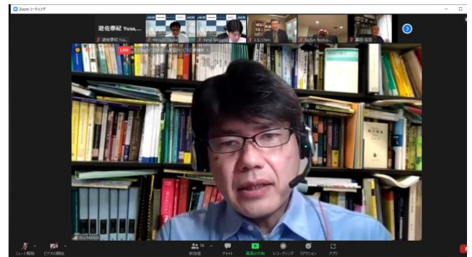
写真2 The JACM Computational Mechanics Award ご受賞の挨拶をされる高木 周教授

10名の先生方は計算力学とその関連分野で大変大きな功績を残されてきた方々です。今回,10名と大変多くの方々々に名誉員に就任頂きましたが,2010年に白鳥正樹先生(横浜国大名誉教授),矢川元基先生(東洋大教授/東大名誉教授),小林昭一先生(京大名誉教授),小林敏雄先生(日本自動車研究所長/東大名誉教授),里深信行(京