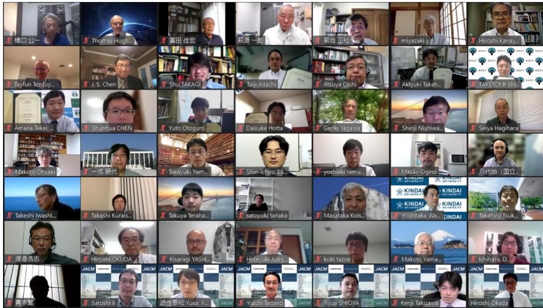
写真3 集合写真（スクリーンショット）

例年出席者全員で集合写真を撮っていたのですが、今回は参加者全員で画面キャプチャーによるオンラン集合写真となりました（写真3）。